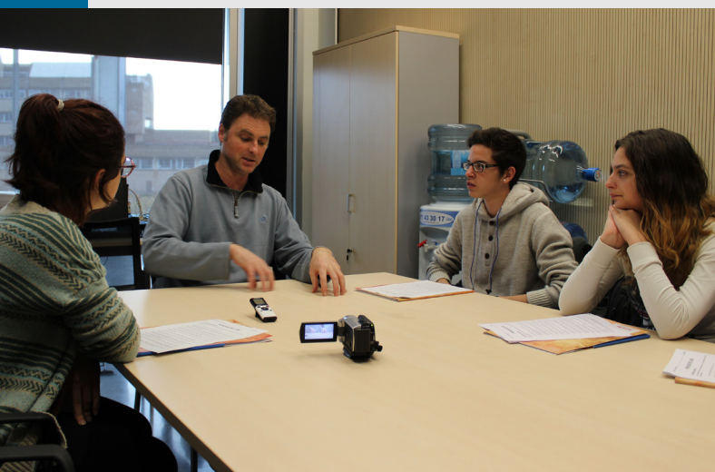
▲ Un moment de l'entrevista.

“ 14.260 alumnes, 2.035 professors i 2.580 assignatures en el CE. ”